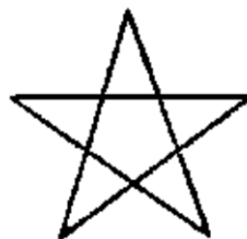
Трети Логос Микрокосмос