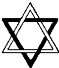
Втори Логос Макрокосмос